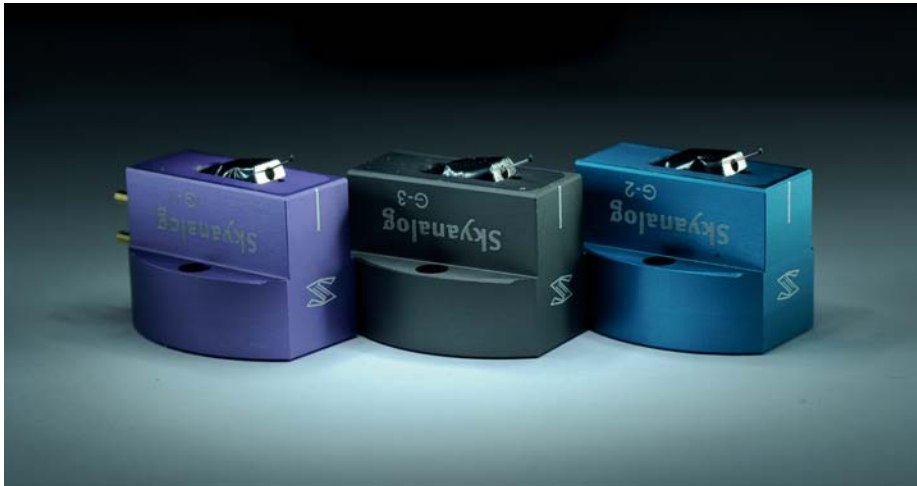
Die MC Tonabnehmer G1, G2 und G3

Als neuen Hersteller hat TCG SKYANALOG im Portfolio. SKYANALOG ist TCGs erster Hersteller aus China. China ist mittlerweile so etwas wie die Werkbank der Welt, ob uns in der westlichen Welt das passt oder nicht. Ich erinnere mich noch an die Vorurteile, die Händler in den 60er Jahren gegenüber „Made in Japan“ hatten. Als ich als Kind für meinen japanischen Kassettenrekorder ein Adapterkabel mit für Cinch auf DIN-Steckern benötigte, schaute man mich im Radio-Fernsehgeschäft mitleidig an