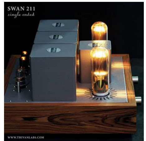
Thivanlabs Swan 211 Single Ended Röhrenvollverstärker

Die Nr. 2 im Portfolio der TCG ist AUDES AUDES wurde 1935 in Estland gegründet und hat somit schon eine lange Tradition. Eckhard Derks ist sehr freundschaftlich mit dem Unternehmenschef verbunden und besucht ihn mit großer Freude jährlich mindestens zweimal. Derks nutzt in seinen privaten Räumen Lautsprecher von AUDES, nämlich die »Excellence 3