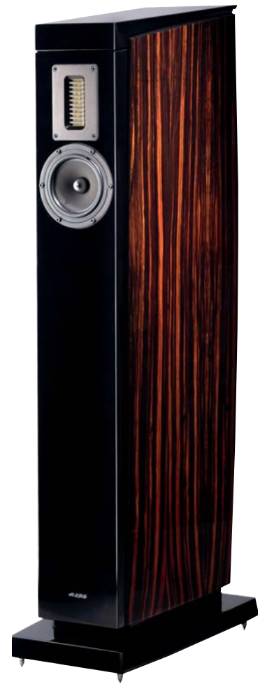
»Excellence 3 AMT«

Ein weiteres Beispiel ist der Standlautsprecher AUDES »Excellence 3 AMT«. Der 3-Wege Standlautsprecher ist der kleinere aus der »Excellence AMT«-Serie. Er verfügt über einen 13er SEAS »Excel«-Mitteltöner mit Gewebe-Kalotte, einen 20er AUDES-Tieftöner mit Papier-Kalotte und ein AMT (Air Motion Transformer)-Hochtöner-Bändchen. Der Hochtöner ist durch einen rückseitigen Regler an den jeweiligen Hörraum anpassbar. Grundsätzlich wurde er für kleinere Räume konstruiert, dennoch klingt er recht erwachsen mit seinem dynamischen Ansprechen und der präzisen Abbildung einer Bühne. Die unteren Frequenzen werden durch den seitlich in der Gehäusewand montierten Audes Tieftöner druckvoll präsentiert. Das kompakte Gehäuse verfügt über 50 mm starke, nicht resonierende Seiten-