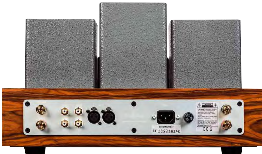
Rückseitig gibt's nur einen Lautsprecheranschluss für vorzugsweise Acht-Ohm-Boxen

Geben wir dem Thivan ein paar Minuten, bis alle Arbeitspunkte stabil sind, und kramen so lange im Plattenregal. Led Zeppelin? Ja, sicher doch, was denn sonst? „Babe I’m Gonna Leave You“ ist genau der richtige Einstieg für so eine Kombination. Voll und warm tönt Jimmy Pages Gitarre von rechts, kräftig und groß Robert Plants Organ von links. Die Haare auf den Armen und im Nacken beginnen sich aufzurichten. John Bonhams erste Schlagzeugattacke macht der Lieblichkeit ein schnelles und rabiates Ende. Ja, ich weiß, dynamisch ist die Passage weit von optimal eingefangen, aber die Stabilität lässt aufhorchen. Hier wackelt nix, die Ping-Pong-Stereo-Spielchen aus dem Jahr 1969 funktionieren großartig. Der Song ist Drama pur und das hört man: Es klingt groß, mitreißend und energisch.