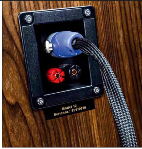
Das Speakon-bestückte Kabel verbindet Bass- und Mittelhochtonabteilung des Model 12