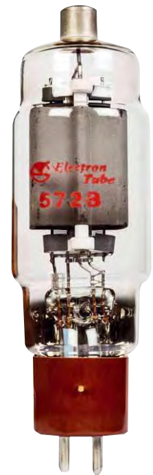
Die 572B ist eine auch heute noch verwendete Senderöhre, sie beruht auf der bekannteren 811A

Die beiden dicken Endröhren quittieren ihren Dienstantritt mit diesem großartigen warmen, fast weißen Glühen – viel heller als das, was man üblicherweise von Röhren kennt. Das, was nur thorierte Wolframkathoden können. Nach wenigen Momenten ist Emission da, wir hören erste Lebenszeichen in Form eines dezenten 100-Hertz-Brumms aus den Lautsprechern, das nach ein paar Sekunden sanft wieder verschwindet. Seit fast 100 Jahren gibt es Verstärker, die auf diese Art ihren Betrieb aufnehmen