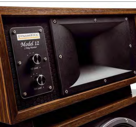
Über zwei Stufenschalter lassen sich Mittel- und Hochtonbereich im Pegel anpassen

und für den beinharten Röhrenfan ist die Prozedur unabdingbar – Verstärker, die das nicht machen kann man nicht ernst nehmen.