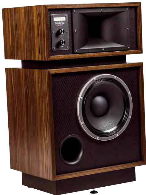
Die Dynamikks Model 12 ist eine Hommage an Altec Model 14 aus den Sechzigern

Folienkondensatoren im Metallbecher unterstützt, die direkt unterhalb der Endröhren angebracht sind. Eine der beiden großen Induktivitäten dürfte eine Drossel sein, die ebenfalls fürs Glätten der Hochspannung zuständig ist. Weitere Bauteileexoten sind die zwei großen Kondensatoren im isolierenden Gummimantel. Die Bauteile der Eingangs- und Treiberstufe sind direkt an den Röhrensockeln angeschlossen, eine Lötleiste dient als zusätzliche Stützkonstruktion.