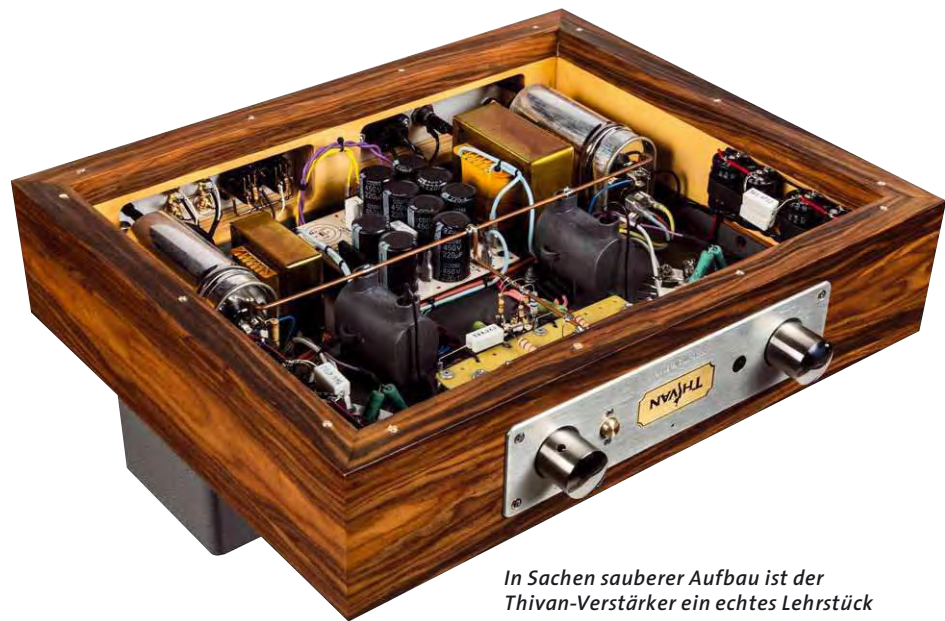
In Sachen sauberer Aufbau ist der Thivan-Verstärker ein echtes Lehrstück