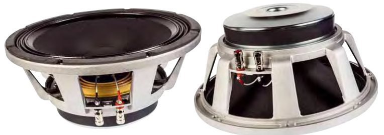
Die Zwölfzoll-Basstreiber sind ernst zu nehmende Beschallungslautsprecher