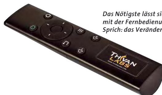
Das Nötigste lässt sich beim Thivan mit der Fernbedienung erledigen. Sprich: das Verändern der Lautstärke