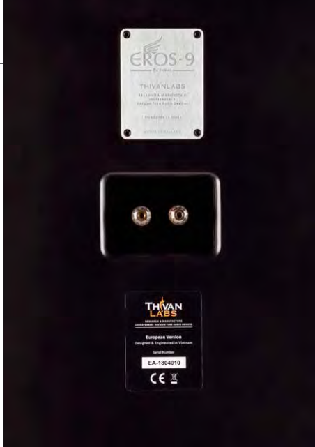
Unter dem Typenschild gibt es ein einfaches Terminal

Luft um die Konturen lässt, sozusagen die Exaktheit eines Horns, verbunden mit der Natürlichkeit einer sehr guten Kalotte und der Energie eines Air-Motion-Transformers. Darunter macht der große Tieftöner bis in den Mitteltonbereich hinein einen mehr als anständigen Job – die zum Tiefbass hin leicht abfallende Abstimmung ist im Wohnbereich genau das Richtige: Es gibt einen trockenen Bass, der durch die Ankopplung an den Boden bis deutlich unter 40 Hertz reicht – für die grenzenlose Dynamik auch elektronischer Musik genau das Richtige.