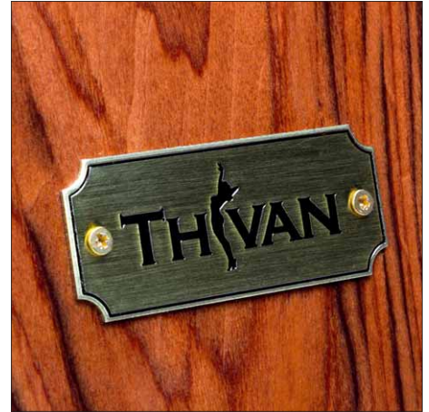
Der vietnamesische Hersteller Thivan Labs feierte unlängst sein 10-jähriges Jubiläum

Nun, die Gefahr besteht, ehrlich gesagt, überhaupt nicht: Mit der Eros-9 bleibt man kein Gelegenheitshörer, so sehr zieht einen die große Box in ihren Bann. Es sind die schier unerschöpflichen Reserven, die diesen Schallwandler so faszinierend machen. Bei normalen Pegeln und dynamischen Verhältnissen ist die Thivan-Box einfach ein sehr guter Lautsprecher. Geht es dann aber im Gesamtpegel zur Sache, dann spürt man einfach die Macht der riesigen Membranfläche, die noch dann jeden Pegelsprung voll mitgeht, wenn alle handelsüblichen HiFi-Boxen längst die Flügel gestreckt haben. Und gerade bei