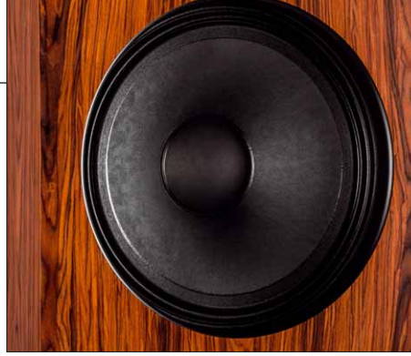
Mit einem mächtigen Fünfzehn-Zoll-Treiber aus dem PA-Regal bearbeitet die Eros-9 den Tief- und Mitteltonbereich

Immerhin sorgt der bodennahe Übergang von Reflexrohr zur Außenwelt für eine maximale Tieftonausbeute. Man kann mit der Höhe der einstellbaren Spikes hier noch ein bisschen variieren. Apropos Spikes: Das zur Eros-9 mitgelieferte Zubehör ist in Sachen Umfang vorbildlich – inklusive der mit Magnetkraft gehaltenen Abdeckungen für die versenkt eingebauten Tieftöner.