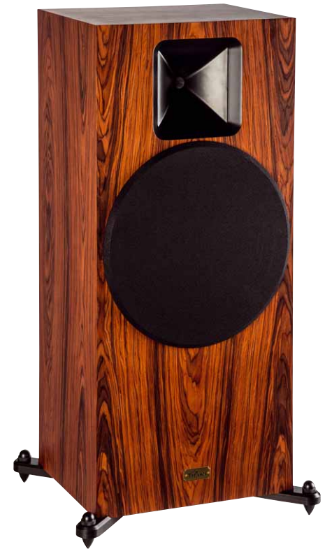
Eine wuchtige, doch noch nicht riesige Erscheinung ist die wirkungsgradstarke Box, hier mit der magnetisch gehaltenen Abdeckung über dem Bass

Den Impedanzverlauf haben wir – als Vorschlag für Single-Ended-Röhrenverstärker – mit einem Saugkreis aus 15 \mu F, 10 Ohm und 0,18 mH linearisiert.